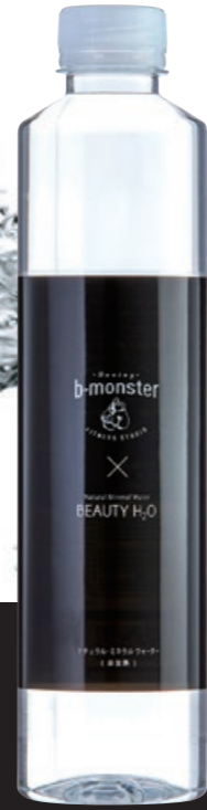
「シリカ」「水素イオン」 ダブルで入っています!! b-monster