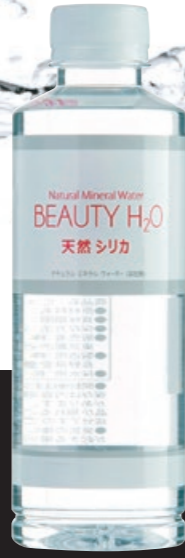
通勤用に作りました!! 美と健康に寄り添う BEAUTY H 2 O