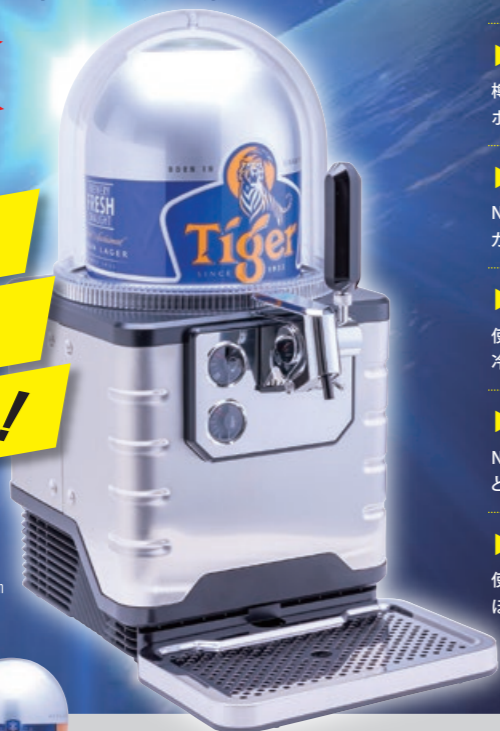
NBC-40 重量：約17kg（樽を含め約26kg） サイズ：W30cm × D46cm × H60cm