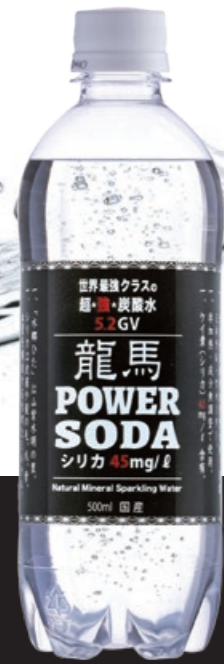
世界最強クラスの超★強★炭酸水 5.2GVガス圧封入!! 龍馬POWER SODA